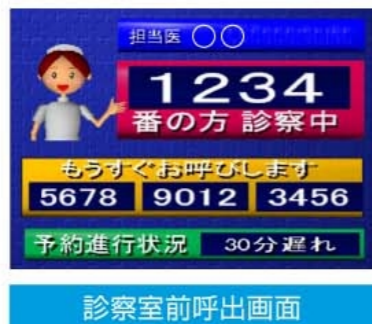
診察室前呼出画面

待合席でお待ちください。診察室前の待合表示板に受付票の番号が診察順に表示されます。